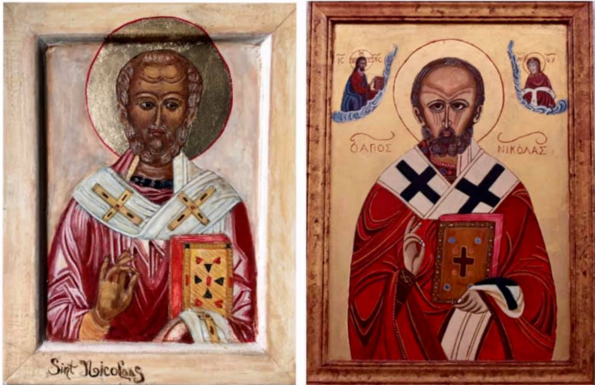
Afbeeldingen: iconen uit de abdij van Egmond en de oud-katholieke kerk in Den Helder.

Bronnen zeggen dat Nicolaas in de 3e eeuw is geboren in Patara, nabij Myra. Op iconen wordt hij vaak afgebeeld met een kort baardje, mediterrane huid en een hoog voorhoofd. Als bisschop is hij gekleed een kazuifel met een witte band versierd met kruizen. Dus geen lange baard of een mijter. De bisschopsmijter kwam pas in de middeleeuwen in gebruik.